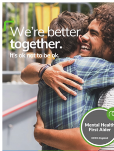
Secouriste en santé mentale.

y compris les organismes nationaux de santé qui organisent des séances de sensibilisation au dépistage précoce. Les activités en ligne, comme les cafés du matin et les cours de Pilates, se sont poursuivies. Favoriser les liens entre les collègues travaillant à distance ou sur le terrain, renforçant ainsi l'engagement de CPM en faveur du bien-être global.