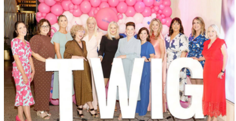
PCPM Ireland célébrant la personnalité de l'année décernée par la TWIG (Tactical Women in Grocery)

Le soutien alimentaire et l'aide aux repas pour les familles, la distribution de panier