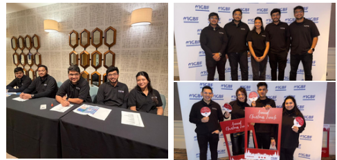
Fonds de bienfaisance des épiciers irlandais

Nos collaborateurs ont continué à faire preuve d'une immense générosité à travers des randonnées d'endurance, des courses annuelles, des tombolas et des appels aux dons saisonniers. Ce soutien a été reversé à diverses causes, notamment la British Heart Foundation, 21st Century Thame, l'Irish Cancer Society et Action Cancer.