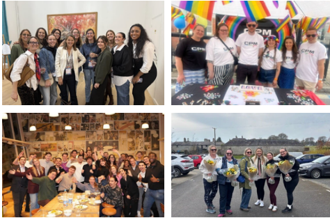
Des expériences partagées qui renforcent le sentiment d'appartenance en France, au Benelux, au Royaume-Uni et en Irlande.

favorisant la représentation et des expériences professionnelles accessibles. Cela s'est traduit notamment par des objectifs de parité au sein des opérations sur le terrain, des tables rondes axées sur l'inclusion, ainsi que des programmes de formation conçus pour aider nos collaborateurs à mieux comprendre et soutenir les approches neuroinclusives au travail.