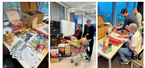
CPM Ireland célébrant la personnalité de l'année décernée par la TWIG (Tactical Women in Grocery).

Ces actions peuvent sembler modestes prises individuellement, mais avec le temps, elles instaurent la confiance, la stabilité et un lien authentique avec les communautés locales.