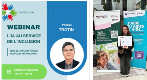
Un webinaire sur l'accessibilité numérique organisé par CPM France et animé par Microsoft France.

Les activités de sensibilisation — allant des ateliers interactifs à l'apprentissage par le biais de campagnes — ont contribué à ancrer l'empathie, la compréhension et l'accessibilité au cœur de la culture de travail quotidienne, garantissant ainsi que les collaborateurs se sentent soutenus à chaque étape.