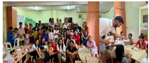
Providing food to children and families in the Philippines

s de saison, les dons de sang et la mobilisation de bénévoles pour des événements caritatifs — y compris le soutien à TWIG — ont contribué à instaurer une culture de générosité au quotidien.