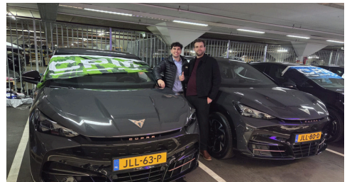
CPM Benelux avec sa nouvelle flotte de véhicules électriques.

La mobilité est demeurée l'un des leviers les plus significatifs pour réduire notre impact environnemental, et l'année 2025 a été marquée par des avancées majeures dans les modes de déplacement de nos équipes. Plusieurs marchés ont intensifié leur recours aux véhicules électriques ; l'une de nos régions a même achevé la transition intégrale de sa flotte de service sur le terrain vers le tout-électrique, franchissant ainsi une étape majeure dans la réduction de nos émissions opérationnelles et l'accélération de notre affranchissement de la dépendance aux carburants traditionnels.