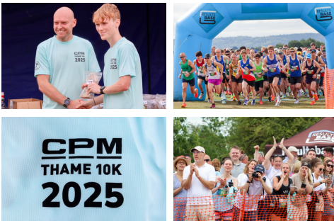
Moments marquants : la Thame 10K 2025 de CPM UK

Notre partenariat de longue date avec la Thame 10K a également franchi une étape majeure cette année, réunissant plus de 1 000 coureurs et renforçant notre engagement en faveur de la santé et du bien-être au sein de la communauté.