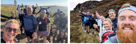
CPM UK en randonnée solidaire : une mobilisation pour collecter des fonds au profit de la communauté.

Notre partenariat de longue date avec la Thame 10K a également franchi une étape majeure cette année, réunissant plus de 1 000 coureurs et renforçant notre engagement en faveur de la santé et du bien-être au sein de la communauté.