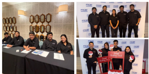
Vrijwilligersfonds van Ierse kruideniers