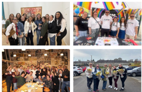
Gezamenlijke ervaringen die verbondenheid versterken in Frankrijk, de Benelux, het VK en Ierland

Zowel in het veld als op kantoor kwamen teams fysiek en virtueel samen. Zo creëerden we een omgeving waarin iedereen gezien, gehoord en gewaardeerd wordt.