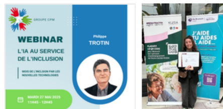
Webinar digitale toegankelijkheid: CPM Frankrijk & Microsoft Frankrijk

We hebben onze focus op toegankelijkheid verdiept met specifieke leersessies, waaronder een webinar over digitale toegankelijkheid door een senior leader van Microsoft Frankrijk. Partnerschappen met organisaties zoals Recruiting droegen bij aan maatschappelijk verantwoorde praktijken, terwijl kaders zoals het Handéolabel onze voortdurende steun voor collega's met zorgtaken onderstrepten.