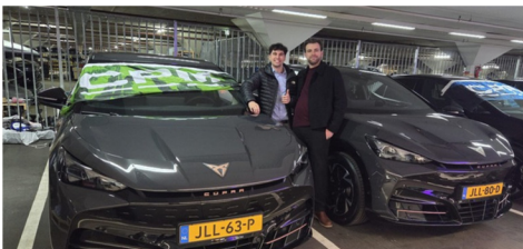
CPM Benelux en hun nieuwe elektrische wagenpark

Mobiliteit bleef een van de belangrijkste stimuli om onze milieu-impact te verkleinen en in 2025 boekten we grote vooruitgang in de manier waarop onze teams reizen. Verschillende markten breidden het gebruik van elektrische voertuigen uit. Eén regio maakte zelfs de volledige overgang naar een compleet elektrisch wagenpark voor de buitendienst; een belangrijke mijlpaal voor het verminderen van operationele emissies en het versnellen van de afbouw van de traditionele afhankelijkheid van brandstof.