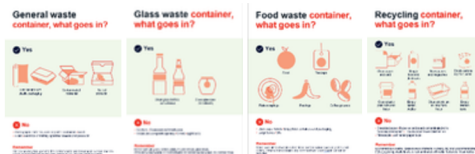
Werken aan dagelijks milieubewustzijn

Daarnaast introduceerden teams papierbesparende processen, digitaliseringsinitiatieven en lokale verbeteringen in de recycling die werkstromen vereenvoudigden en afval verminderden. Sommige markten investeerden in biodiversiteitsprojecten op hun locaties, wat het idee versterkt dat de verantwoordelijkheid voor het milieu praktisch, zichtbaar en lokaal geworteld kan zijn. Door deze gecombineerde inspanningen werd milieubeheer onderdeel van het dagelijkse werkritme, wat onze collectieve toewijding aan het verkleinen van onze impact op de planeet versterkt.