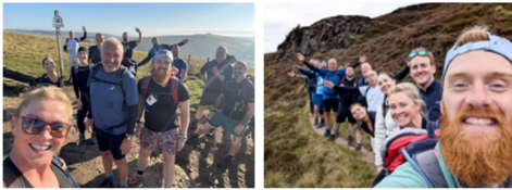
CPM UK hiking for impact: geld ophalen voor de gemeenschap

In Ierland haalden onze teams € 4.000 op. In het VK overtroffen teams hun doelen tijdens grote wandeltochten, waarbij CPM de opbrengstbovendien verdubbelde.