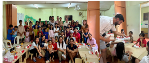
Voedselhulp aan kinderen en gezinnen in de Filipijnen

Voedselondersteuning voor gezinnen, seizoensgebonden hulppakketten, bloeddonthaties en ondersteuning bij liefdadigheidsevenementen (waaronder TWIG) droegen bij aan een cultuur van dagelijkse vrijgevigheid.