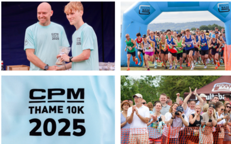
Mijlpaalmomenten: De CPM VK Thame 10K 2025

Onze jarenlange sponsoring van de Thame 10K bereikte dit jaar een mijlpaal. Met meer dan 1.000 lopers versterkten we hiermee onze inzet voor de gezondheid en het welzijn van de gemeenschap.