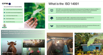
Emissiereductie door slimmere keuzes

Een van de meest aanzienlijke dalingen was te zien bij reisgerelateerde activiteiten. Een moderner wagenpark, gecombineerd met datagestuurde inzichten, hielp collega's om weloverwogen keuzes te maken over routes, voertuiggebruik en planning. Deze inzichten stimuleerden een bewustere besluitvorming en ondersteunden een cultuur waarin het verminderen van emissies een gedeelde verantwoordelijkheid werd in plaats van een op zichzelf staand doel. De resultaten tonen aan dat wanneer collega's zowel de logica als de impact van hun acties begrijpen, blijvende verandering mogelijk wordt.