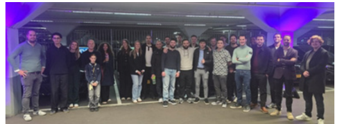
Training voor een zuinigere en efficiëntere rijstijl

Deze ontwikkeling werd versterkt door de introductie van voertuigen met een lagere uitstoot, waardoor de duurzame opties werden uitgebreid voor collega's die voor hun functie veel onderweg zijn.