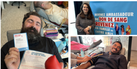
Collega's van CPM France die bloed doneren

Collega's zetten zich opnieuw in via wandeltochten, hardloopevenementen en loterijen. Hiermee steunden zij doelen zoals de British Heart Foundation, 21st Century Thame, de Irish Cancer Society en Action Cancer.