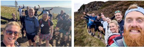
CPM UK in cammino per l'impatto: raccolta fondi a sostegno della comunità

In Irlanda sono stati raccolti € 4.000. In UK sono stati superati gli obiettivi di fund raising in 2 importanti percorsi escursionistici e CPM ha contribuito con un importo equivalente, raddoppiando l'impatto.