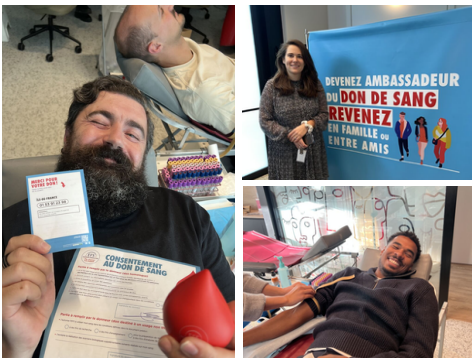
Colleghe e colleghi di CPM France donano il sangue

In tutta la nostra rete, colleghe e colleghi hanno sviluppato iniziative coerenti a livello globale e rilevanti per le comunità in cui vivono e lavorano. Tra le iniziative realizzate figurano una raccolta sangue in sede con l'Établissement Français du Sang (EFS), interventi di pulizia urbana promossi dai comuni e attività di volontariato in spazi comunitari che beneficiano di ulteriore attenzione e supporto.