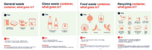
Building everyday environmental awareness

Parallelamente, i team hanno introdotto processi per ridurre l'uso della carta, iniziative di digitalizzazione e miglioramenti nei sistemi di riciclo a livello locale, rendendo i flussi di lavoro più efficienti e riducendo gli sprechi. In alcuni mercati sono stati, inoltre, avviati progetti a favore della biodiversità nei siti operativi, rafforzando l'idea che la responsabilità ambientale possa essere concreta, visibile e radicata nei territori. Nel loro insieme, queste azioni hanno integrato la tutela dell'ambiente nel lavoro di ogni giorno, consolidando l'impegno collettivo nella riduzione del nostro impatto sul pianeta.