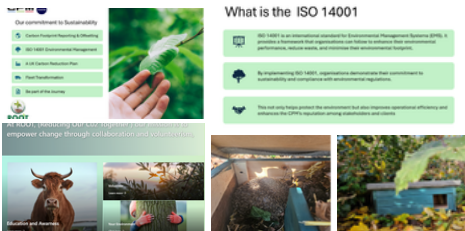
Riduzione delle emissioni attraverso scelte più consapevoli

Una delle riduzioni più rilevanti ha riguardato gli spostamenti. Il rinnovo delle flotte, integrato da analisi data-driven ha consentito alle persone di compiere scelte più informate in termini di percorsi, utilizzo dei veicoli e pianificazione. Questo ha favorito un processo decisionale consapevole e sostenuto una cultura in cui la riduzione delle emissioni è diventata una responsabilità condivisa, anziché un obiettivo isolato. I risultati mostrano che la comprensione delle motivazioni e dell'impatto delle proprie azioni rende possibile un cambiamento duraturo.