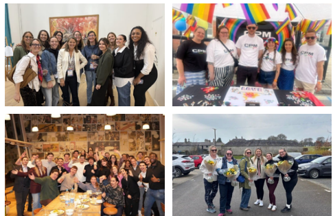
Esperienze condivise che rafforzano il senso di appartenenza in Francia, Benelux, Regno Unito e Irlanda

Pasti condivisi, incontri culturali ed eventi regionali hanno favorito relazioni autentiche, rafforzando la comprensione reciproca e l'identità dei team. Le persone di sede e quelle sul territorio hanno potuto incontrarsi creando spazi in cui si sentono visti, ascoltati e valorizzati.