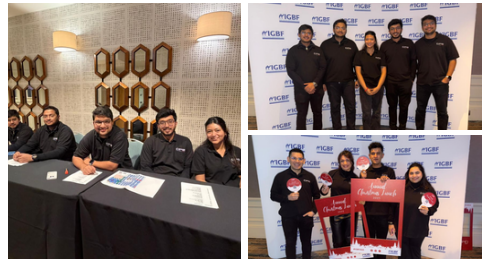
Irish Grocers Benevolent Fund

Le nostre persone hanno continuato ad amplificare il proprio impegno attraverso trekking di resistenza, corse annuali, lotterie e campagne stagionali, sostenendo cause come la British Heart Foundation, 21st Century Thame, l'Irish Cancer Society e Action Cancer.