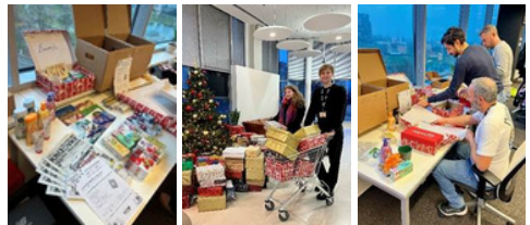
CPM in Slovacchia: pacchi dono per le persone anziane

Queste azioni che, se considerate singolarmente, possono apparire contenute, ma nel tempo costruiscono fiducia, stabilità e un legame autentico con le comunità locali.