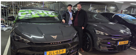
CPM Benelux con la nuova flotta elettrica

La mobilità si è confermata una leva chiave per ridurre il nostro impatto ambientale: nel 2025 abbiamo compiuto progressi rilevanti nelle modalità di spostamento dei team. In diversi mercati è aumentato l'utilizzo di veicoli elettrici, con un Paese che ha completato la transizione verso una flotta operativa interamente elettrica per le attività sul territorio. Un traguardo che contribuisce alla riduzione delle emissioni operative e accelera il superamento della dipendenza dai carburanti tradizionali.