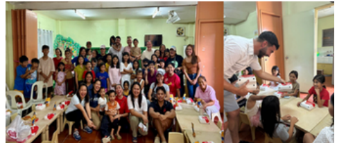
Providing food to children and families in the Philippines

Il supporto alimentare a famiglie e nuclei in difficoltà, la distribuzione di pacchi solidali stagionali, le donazioni di sangue e il supporto operativo a eventi benefici — incluso il sostegno a TWIG — hanno contribuito a diffondere una cultura della generosità quotidiana.