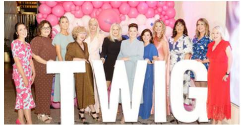
CPM Ireland celebra la vincitrice del premio TWIG (Tactical Women in Grocery) Person of the Year

Accanto alle iniziative su larga scala, le nostre persone hanno valorizzato piccoli gesti quotidiani e coerenti che, nel loro insieme, rafforzano organizzazioni e comunità.