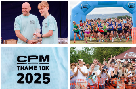
Un traguardo significativo: la CPM UK Thame 10K 2025

La sponsorship storica della Thame 10K ha rappresentato un traguardo rilevante, con oltre 1.000 runner e un rinnovato impegno per la salute e il benessere delle comunità.